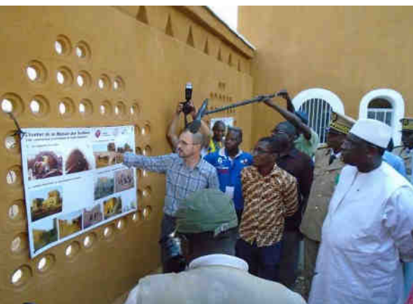
Visite du Président Macky Sall à la Maison des Yvelines à Ourossogui