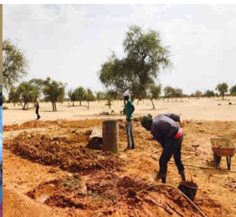
Préparation des briques