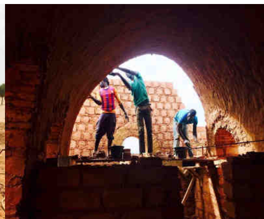
Réalisation et tirage de la voûte